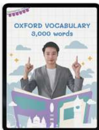
คำศัพท์ OXFORD 3,000 คำ