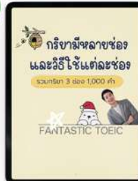
กริยา 3 ช่อง 1,000 คำ