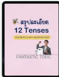
สรุป 12 TENSES อย่างละเอียด