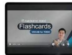
5 VDO SPECIAL, ดอร์ส FLASH CARD คำศัพท์แบบไม่ต้องท่อง 1,250 คำศัพท์