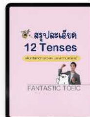
2 สรุป 12 TENSES อย่างละเอียด