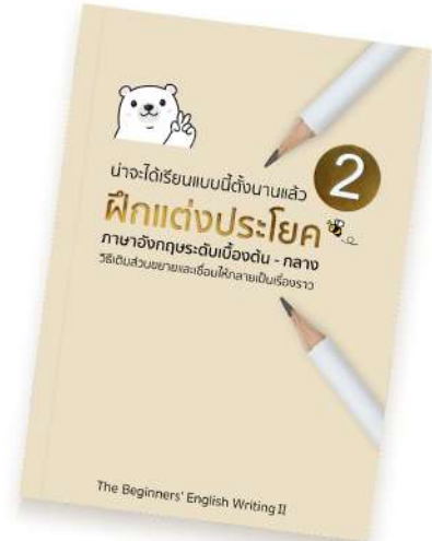
หนังสือแต่งประโยค 2