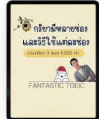
3 กริยา 3 ช่อง 1,000 คำ