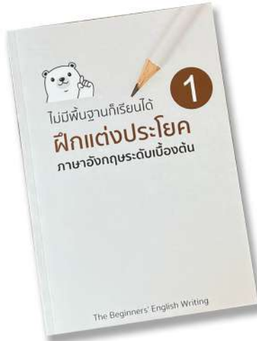
หนังสือแต่งประโยค 1