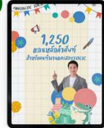
คำศัพท์ 1,250 คำ สำหรับ คนทำงานและสอบ TOEIC