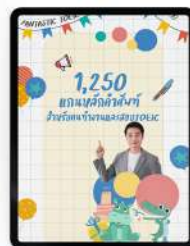
4 คำศัพท์ 1,250 คำ สำหรับ คนทำงานและสอบ TOEIC